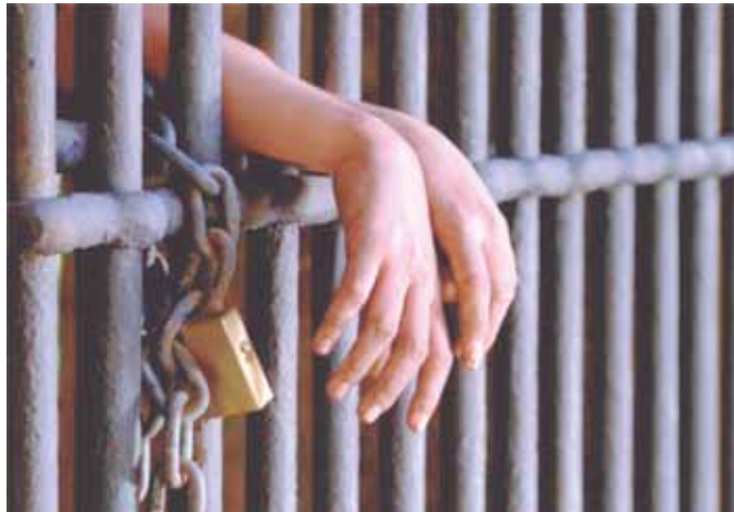
El MP ratificó la acusación contra el hombre por el delito de femicidio agravado.

En el juicio, el representante del Ministerio Público de esa jurisdicción ratificó la