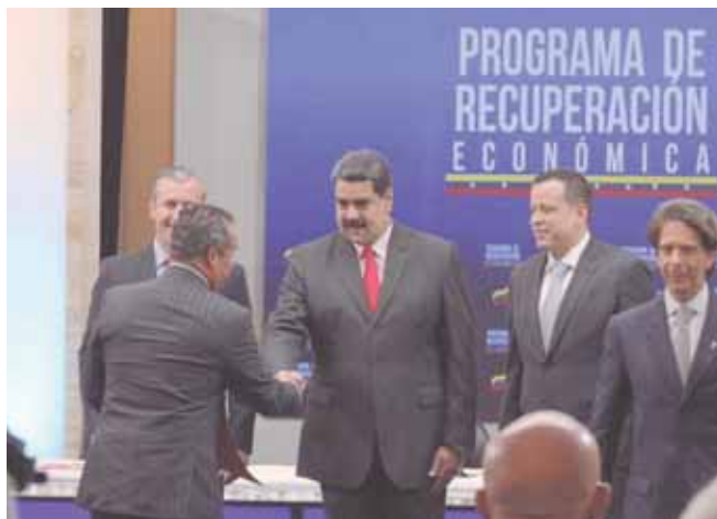
El presidente Nicolás Maduro hizo el llamado el Día Mundial del Ahorro.

“La guerra económica siempre va a existir mientras exista nuestra voluntad firme e irrenunciable de ser libres e independientes”. Tareck El Aissami