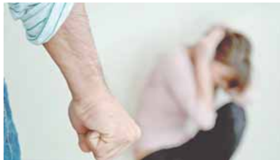
El femicidio es la expresión más cruenta del machismo.

Pudiera decirse que el acoso sexual también ha ido en aumento y son todos estos hechos los que han llamado a la re-