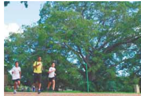
Las instalaciones del Parque Alí Primera se han convertido en un lugar habitual de entrenamiento.

Quienes deseen visitar este hermoso parque, que le rinde honores al músico, cantante, compositor, poeta, activista político y militante comunista Alí Primera, pueden asistir de martes a domingo, en el horario comprendido entre las 9:00am y las 4:00pm, tomando la avenida Sucre de Catia o utilizando la Línea 1 del Metro de Caracas y bajándose en la estación Gato Negro.