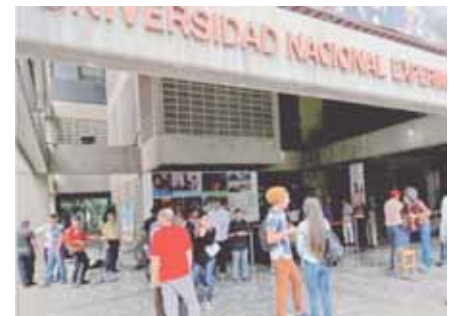
Castillo señaló que estas acusaciones "sin sustento jurídico" afectan su labor como profesor en Unearte.

También criticó que Faldas-R dé mayor importancia a ocasionar perjuicios laborales en su contra y no a exigir justicia para las presuntas víctimas. "Parecen de hecho y de derecho, más interesadas en la remoción laboral que en demostrar sin pruebas lo que afirman con base en datos abiertamente falsos", agregó.