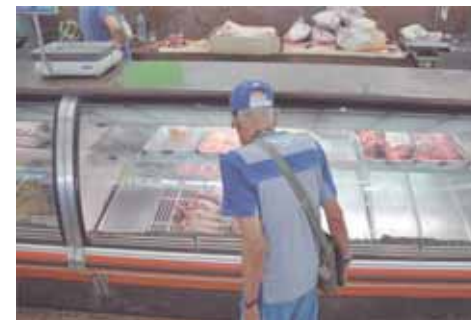
La proteína animal desapareció de los frigoríficos.

Todo esto lo contó desde la puerta de su casa, donde ese día había puesto una mesa para ir ordenando uno sobre otro, cartones de huevos. Su inspirada historia era pocas veces interrumpida por un contrapunteo: “¿A cómo el medio cartón?” Y con cariño les decía “a 350, mi amor”. —“¿Tienes punto?”