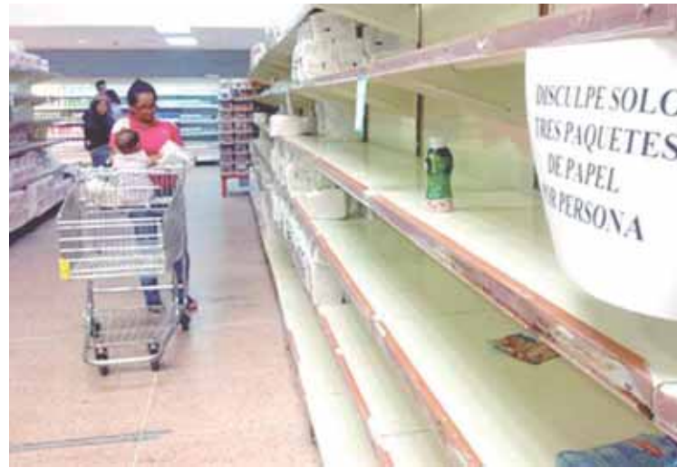
La escasez, contrabando de alimentos y especulación siguen campantes.

Mientras tanto esperemos el pernil, que viene completo, grande y gordote, dijo Nicolás.