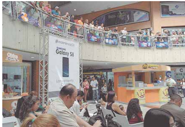
En el City Market es posible comprar un teléfono con dólares en efectivo.

A esa situación se le suma el comercio interno. La mayoría de los venezolanos no se pueden explicar que el precio de algunos productos, como por ejemplo el del queso duro, se situara en alrededor de los 50 soberanos apenas el 20 de septiembre y ya esta semana ronde los 500, au-