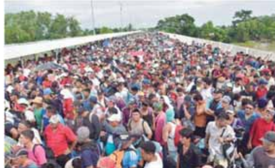
La muchedumbre busca oportunidades para su existencia.

Quienes han logrado migrar y se han asentado en