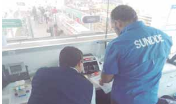
La Sundde asegura que sus inspectores están atentos en la calle.

Lo mismo pasa con las tarifas del pasaje del transporte público. El Ministerio del Poder Popular para el Transporte, a través de la Gaceta Oficial N° 41.468, de fecha 27 de agosto de 2018, estableció tarifas máximas en sus áreas de competencia para el Transporte Privado y Público, estableciendo que el pasaje urbano tendría un valor de Bs$ 1; el pasaje suburbano y de recorridos lar-