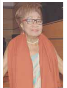
Una rumba memorable con "Canelita".

Lo cierto es que algo bueno pasará el 11 del mes 11 a las 11 de la mañana: soneros y baladistas pondrán a vibrar al público junto a la Orquesta Gran Mariscal de Ayacucho, dirigida por Elisa Vegas, en honor a "La sonera del Caribe". ¡Impedible esa rumba!