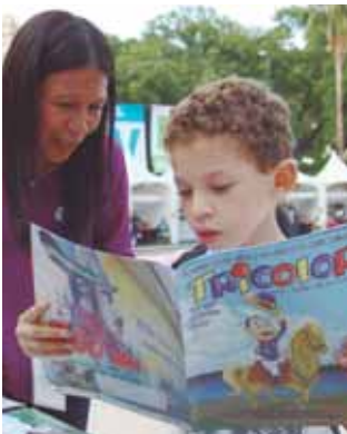
Los pequeños tendrán su espacio en el Teatro Bolívar.

Estará presente en el Teatro Bolívar, donde más de 90 actividades se efectuarán, destacando talleres teatrales, escritura para niños, cuentacuentos y el disfrute de la obra Los hombres de los cantos amargos , bajo la actuación de 325 niños pertenecientes al Movimiento Teatral César Rengifo los días 10, 11, 17 y 18 de noviembre.