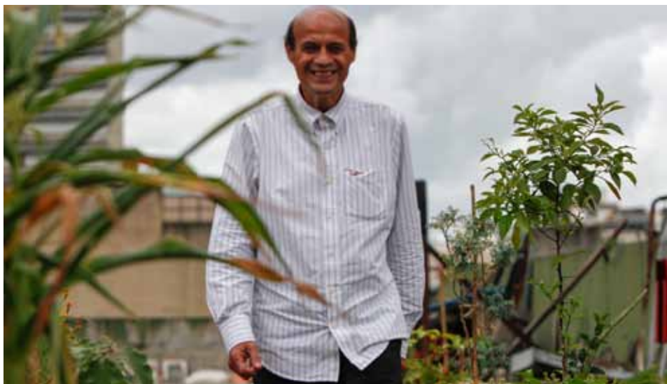
Valenzuela estará siempre en la defensa de los derechos culturales y el respeto a los patrimonios inmateriales.

que entre 20 o 24 años celebraría el velorio de la cruz y lo cumplió como tal. Así como la Cruz de Mayo, están otras manifestaciones culturales, el baile, el joropo llanero, tuyero y oriental, la poesía popular, la décima, entre otros. Todas estas manifestaciones se mantienen independientemente de que haya pandemia o que el Estado lo tome en cuenta de una manera precisa y articulada en los sectores populares. Entonces, ahí está la gran esperanza de nosotros, es una esperanza y la posibilidad de dar respuesta, porque nuestra cultura realmente se encuentra en resistencia, una cultura que coexiste en un mundo industrial masivo con toda una penetración propagandística de malos hábitos de consumo. Pero la gente al ejercer la cultura popular lo hace desde sus hogares o trabajo, al hacer una arepa, al conocer el folclor y dar respuesta a la tradición y a la historia, y eso permite la existencia de lo que se ha discutido actualmente sobre la cultura, ya que es perenne en nosotros como identidad y diversidad cultural.