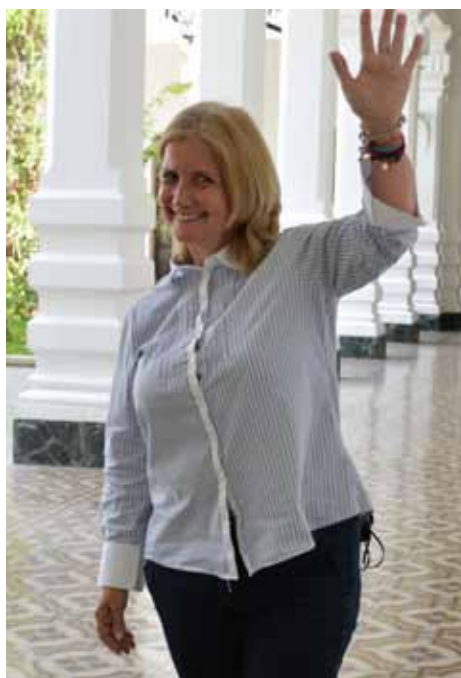
Desde el Palacio Municipal, futuro Museo de Caracas.

La Torreta perteneció al convento de San Francisco, que estaba allí y demolió Guzmán Blanco a finales del siglo XIX. Está al lado del Pasaje Linares, en la plaza San Jacinto. “Rescatamos