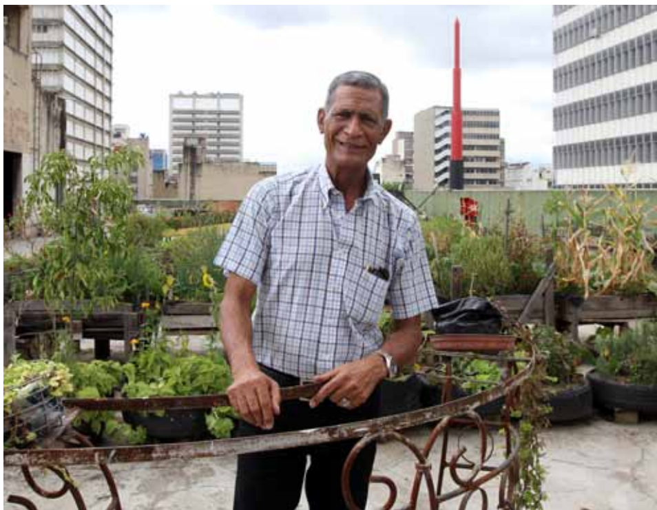
Un veterinario imbuido en la historia de una batalla que sigue marcando el destino de la Patria Grande.