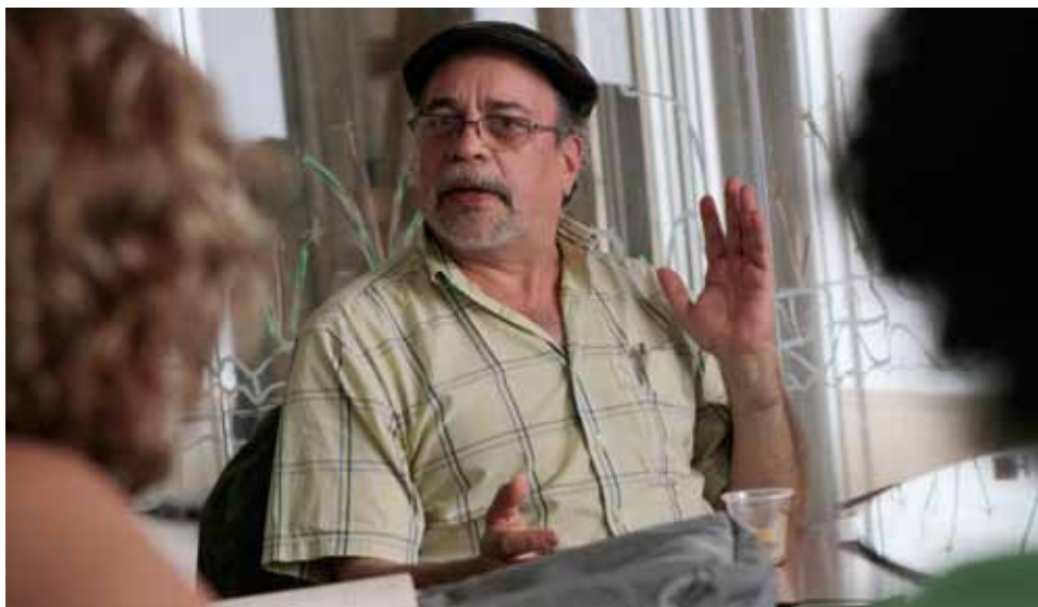
El profesor e historiador conversó en nuestra Redacción con el equipo de Ciudad CCS.

pareciera que no pasaba nada, no hay grandes enfrentamientos ni hechos militares, pero fue el año del armisticio y la regularización de la guerra y se van moviendo posiciones como en un juego de ajedrez.