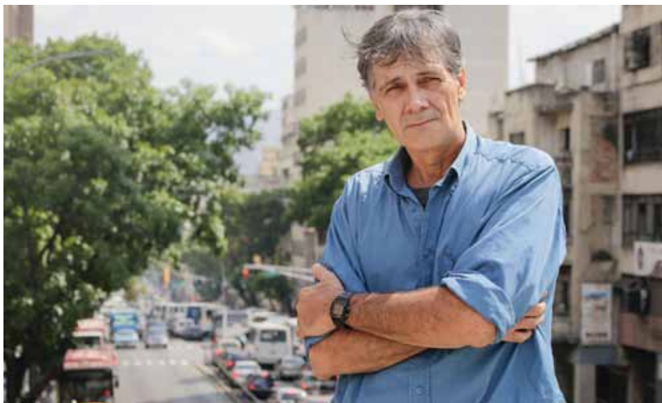
El cineasta salió el 11, 12 y 13 de abril de 2002, cámara en mano, a registrar lo que pasaba en las calles.

guardar a las compañeras y los compañeros. Era un momento duro y se debían tomar precauciones. Respecto del balance, creo que ese trabajo sigue vigente por la fuerza de la historia que se construyó en esos días. Se trató de algo inédito y gigante, es decir, un pueblo que va y rescata a su compañero en el Gobierno, doblegando el brazo de una maquinaria mediática brutal. Pienso que el aporte y el valor que pudiera tener el documental también pasa por mostrar las imágenes del pueblo movilizándose en cada uno de los sitios, y no a un político o periodista hablando de lo que pasó. Recalco que fue un trabajo realmente colectivo donde muchas de las imágenes provinieron de gente de a pie que grabó con sus handycams, vecinos de la zona, medios comunitarios, incluso de los canales privados de televisión sumados al golpe, cuyos trabajadores nos acercaron material bajo cuerda.