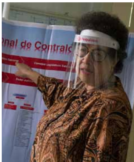
La luchadora revolucionaria muestra una de sus propuestas a la AN para enfrentar la corrupción y la burocracia.

—Dije anteriormente que estamos en esta Re-