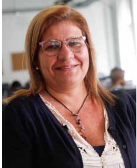
La economista sostuvo un diálogo ameno con el equipo de periodistas de Ciudad Caracas.

“Eso tiene un efecto sobre las exportaciones petroleras, disminuyen las exportaciones petroleras y eso incide sobre la producción nacional. ¿Por qué? La respuesta es simple, porque disminuyen las divisas para importar materias