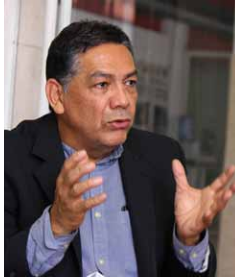
El viceministro disertó sobre sus labores en el nuevo despacho en el Ministerio de Relaciones Exteriores.

Para combatir el bloqueo se hace necesario ejercer el comercio exterior con países y empresas sin dar nombres, es decir, de manera secreta, para evitar algún embargo, tal como sucedió con los barcos petroleros que venían a nuestro país en mayo pasado, los cuales fueron secuestrados por los gringos y luego negociaron el producto para su beneficio.