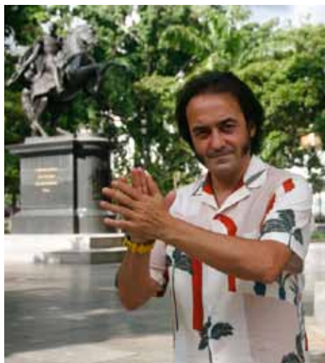
Quedó prendado de Bolívar con el libro que registra las cartas de amor entre nuestro Libertador y la Manuelita Sáenz.

—Yo siento, en mi parte cultural, que es una buena relación porque el mundo de la cultura y en el caso nuestro, el flamenco no tiene fronteras, no tiene barreras. Aquí en Latinoamérica se entiende perfectamente lo que canta un cantaor, pero en otros países como China, Japón, Rusia, Australia, Canadá, aunque no entienden el lenguaje, les llega el sentimiento de ese cante, de esa queja, esa protesta o esa alegría. Creo que el flamenco no tiene color, no tiene banderas, solo la bandera de la libertad y creo que el entendimiento cultural es muy importante, el que hay entre España y Venezuela. ¿A nivel político? conocéis perfectamente las situaciones políticas que hay, unas veces va pa' arriba otras veces va pa' abajo, es un vaivén. Desde el escenario intento demarcar ese mensaje como artista, o como persona, mis pies son los que hablan por mí, y mis espectáculos hablan de mi pensamiento.