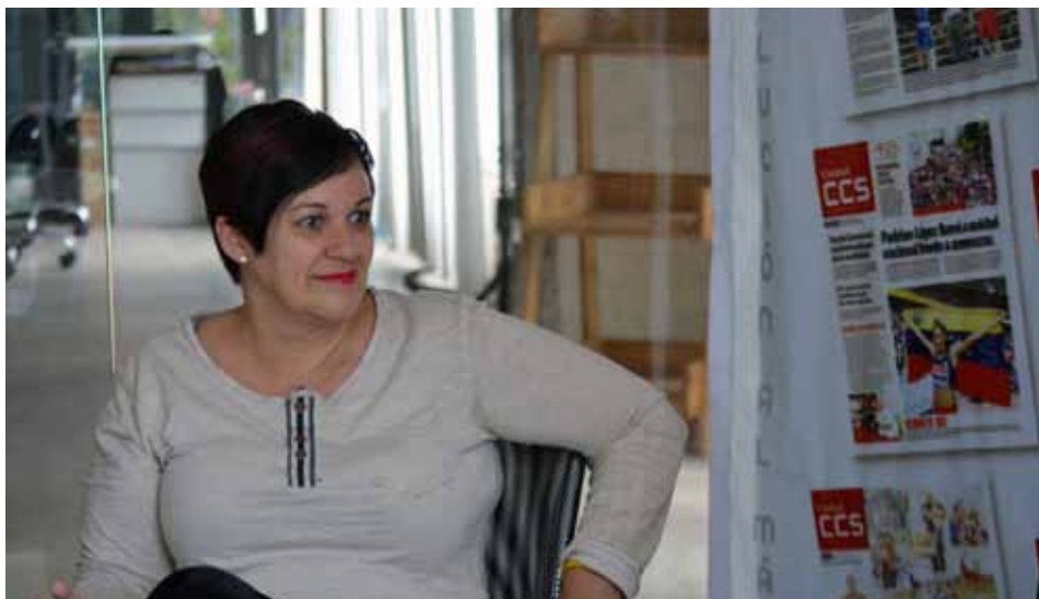
La constituyente tuvo un diálogo ameno en la Redacción de Ciudad Caracas.

de facto por la cual está transitando la economía venezolana en los últimos años y precisó que en la actualidad hay más dólares en la calle que en los años de bonanza, porque en esa época Venezuela era el país con más alto nivel de vida en América Latina, y la población no necesitaba acudir al dólar para proteger su bolívar, ya que esta moneda para esos años tenía fortaleza.