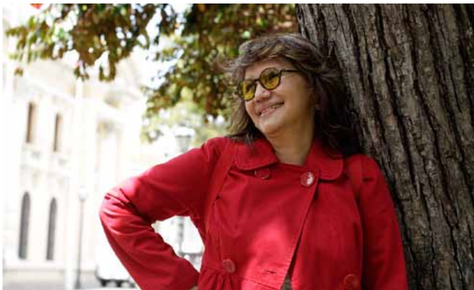
Poeta que no es poeta, música con pasión, doctora con vocación.

Táchira y luego al estado Bolívar. Esas son cosas extraordinarias que en otros países no se han hecho. ¿Cómo es eso que toman las muestras en Amazonas, en Macanao y llegan al Instituto Nacional de Higiene? Este Gobierno creó un puente aéreo. ¿Cuál país del mundo pudo disponer de una flota de aviones que recogiera las muestras de las regiones y las trajera a Caracas? La verdad verdadera es que esa es una respuesta, ante la pandemia, impecable. Y absolutamente gratuito”.