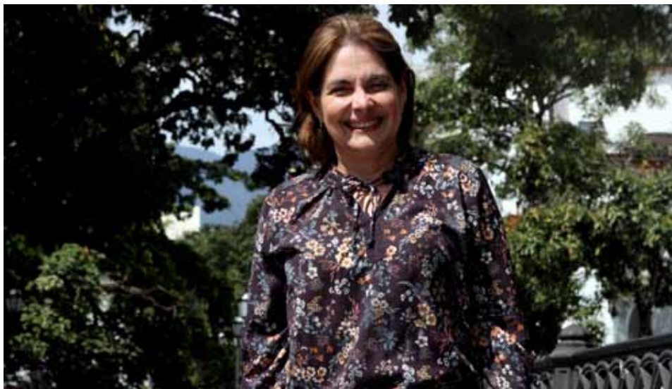
De niña empezó a curiosear los encantos de la naturaleza, a los 8 años dijo a su mamá que estudiaría Biología.

más recalcitrante de la educación universitaria del país y de los centros de investigaciones. La investigación científica solo la realizaban los académicos. Con la Constitución de 1999, Chávez establece que la ciencia y la tecnología es una herramienta para el desarrollo del país y lo convierte en un elemento constitucional, cosa que nunca había ocurrido, crea el ministerio y nace la Ley Orgánica de Ciencia, Tecnología e Innovación, ahí se da un salto que rompe con la realidad que existía en el país con los actores del Sistema Nacional de Ciencia y Tecnología (SNCT) porque le incluye un elemento transformador que forma parte del despertar de la conciencia de nuestro pueblo con las instancias del poder popular, y si es así, una dice entonces que cualquier venezolano puede ser actor del SNCT porque no basta con que seas académico. Paralelo a eso ocurre la municipalización de la educación universitaria, que la gente no la vincula con la ciencia, ni con el incremento