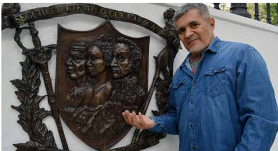
Personajes históricos, fechas insigne, guacamayas y la estrella de la revolución son la identidad de Caracas.