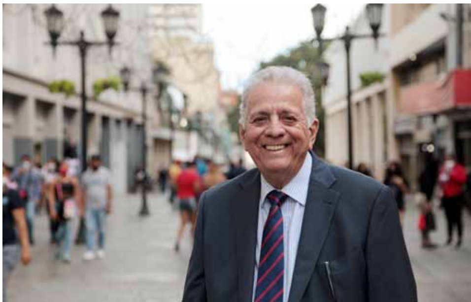
Abogado y poeta, también ejerció como diplomático en Europa.

que continuó: “Chávez logró algo muy importante en la política, que es la confianza. El pueblo confiaba en Chávez y en su gobierno. Esa confianza generó alguna seguridad: por fin tenemos alguien con quien construir y conversar, alguien que nos oye. Ese arranque de Chávez generó expectativas que no son solo venezolanas. Venezuela es una referencia de un proceso social complejo, con EEUU tratando siempre de detenerlo. Es un país que no se entrega, es un país que lucha, un país donde la mujer se ha integrado hasta el punto de ser un baluarte de este proceso. Esa imagen la tenemos todavía en el exterior (vengo de vivir diez años en Europa), a pesar de los errores que hemos cometido, aun con esta presión del bloque de EEUU y Europa, aun cuando dentro del Gobierno algunas individualidades no están todo lo comprometidas que quisiéramos. A pesar de todo eso, seguimos siendo una referencia. La gente consciente del mundo dice: ‘Queremos pa-