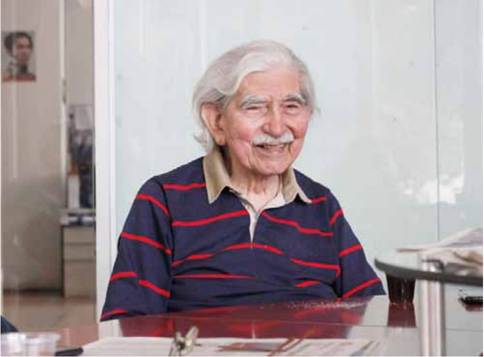
Defensor e impulsor del modelo comunal. Éste tipo de organización representa un peligro para el capital.

te se organice por sí misma. La organización con autonomía para el capital es un peligro.