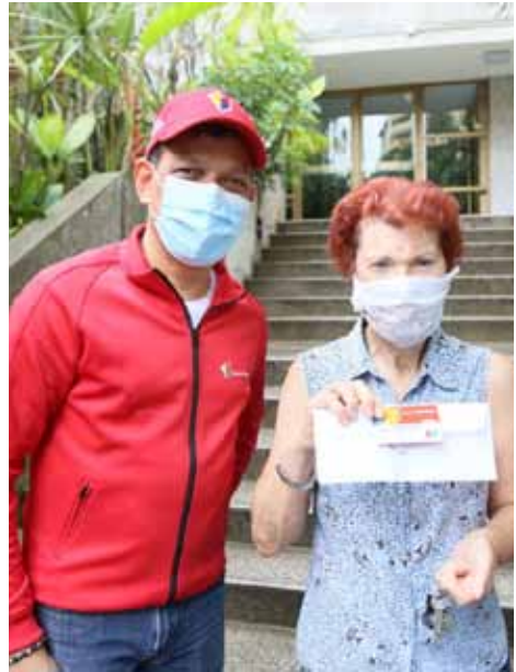
El Banco de Venezuela se convirtió en un ejecutor de las políticas sociales y revolucionarias.

—Con la crisis bancaria que hemos vivido, el país se ha blindado. El sistema regulatorio de la Superintendencia de las Instituciones del Sector Bancario (Sudeban) y otras instituciones financieras, el Banco Central y el Ministerio del Poder Popular para las Finanzas han evitado la permisividad a los banqueros y se ha fortalecido la banca en los últimos años. No soy banquero. Soy un cuadro del PSUV que asumió la responsabilidad de este banco del Estado como un gran reto. Te cuento una anécdota: esos banqueros me invitaron a una asamblea con productores de papa en El Tocuyo y cuando comenzó la reunión me llamaron aparte: “Esta gente no tiene