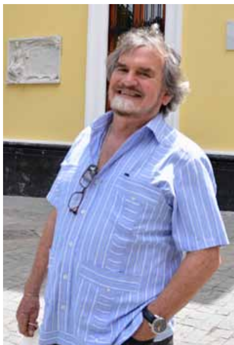
A la cabeza del CNAC plantea el diálogo con la industria cinematográfica.

—Es una necesidad política y la posibilidad de