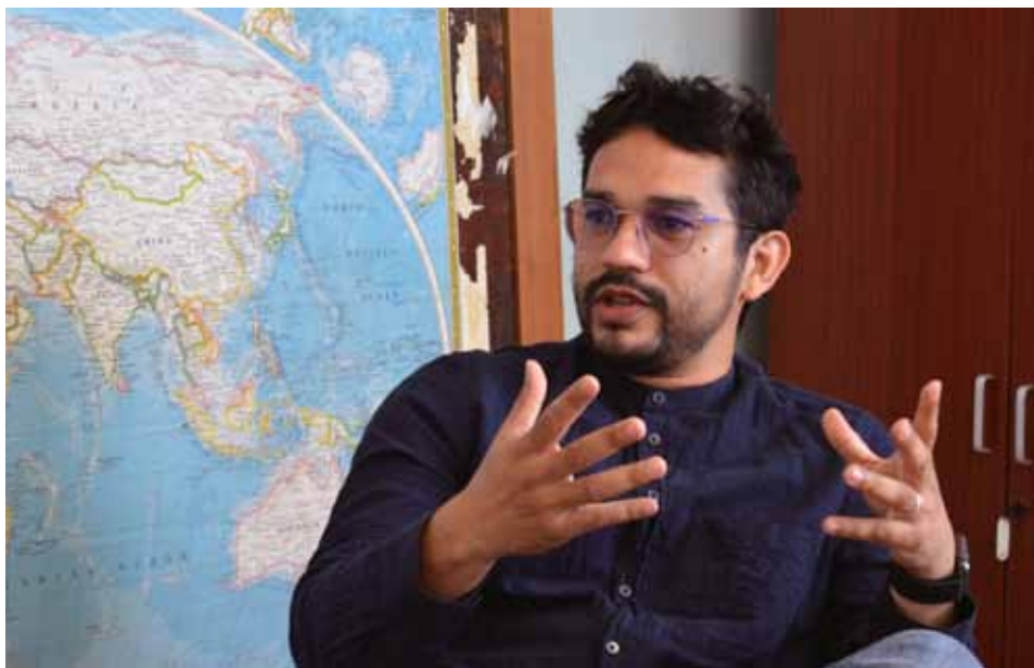
El músico, escritor, y también poeta barinés, socializó la experiencia como autor del blog Cuaderno hipertextual.