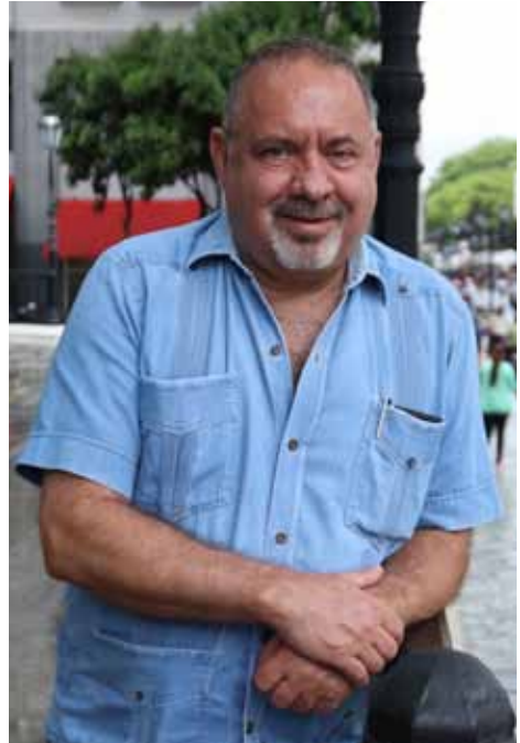
Consultor y analista internacional venezolano.

Lo mismo ocurre en Asia. La Unión Europea, más allá de ser lo que sea, hay una unión, tienen una moneda única. ¿Entonces nosotros no podemos? No podemos porque tenemos una oligarquía retrógrada, atrasada que no nos permite avanzar y, claro, somos el patio trasero. El esfuerzo de EEUU para controlar su entorno