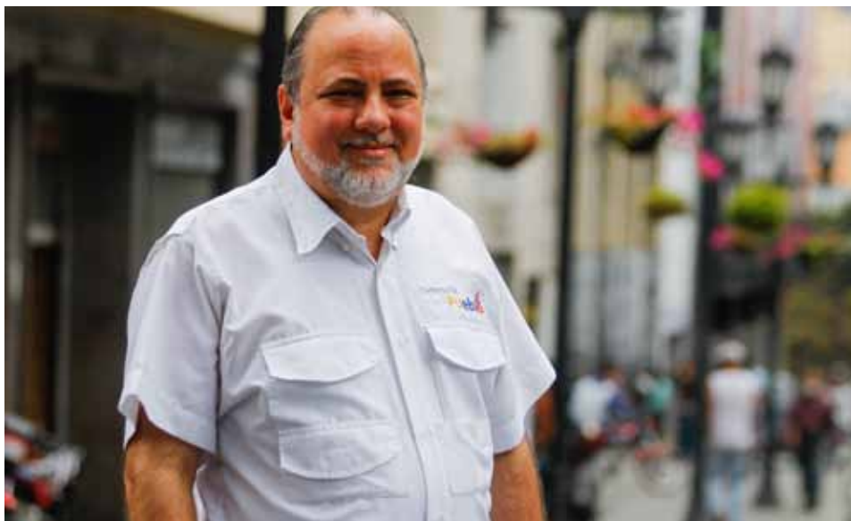
El defensor del pueblo tiene la disposición de estar al lado del pueblo y opta a favor de los DDHH.

ron cualquier tipo de ayuda, no se le daba la atención adecuada a los ciudadanos venezolanos en esos países, sin embargo, en ese aspecto la institución, en conjunto con las defensorías de esos países, por esa labor humanitaria que se mantuvo, no fueron cortadas las relaciones, aún se mantienen las comunicaciones con las defensorías de esos países y se ha logrado resolver situaciones tan comunes como, por ejemplo, cuando se cerró la frontera y había ciudadanos colombianos en el país por cuestión de estudios académicos, se logró mediar y abrir ese paso a la reconciliación con los pueblos.