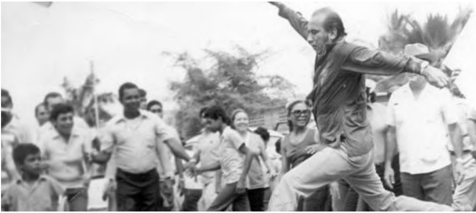
Saltador de charcos en campaña electoral

loco (no sé si pa' él o pa' ti), pero pa' mí, tú estás loco!”