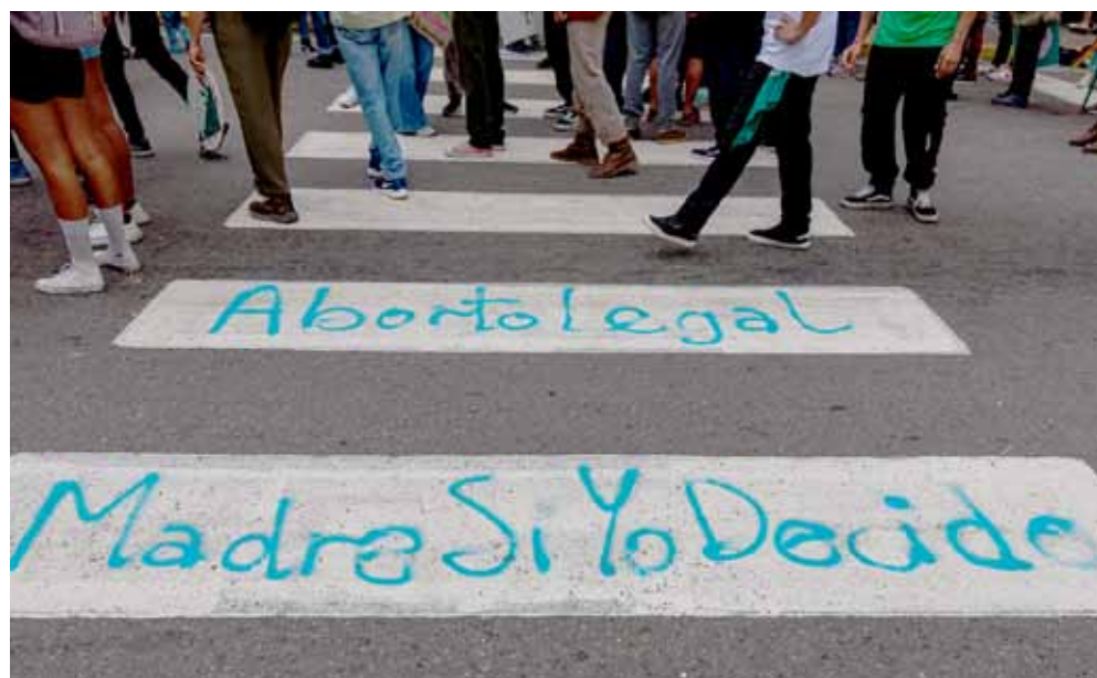
La maternidad sera deseada o no será