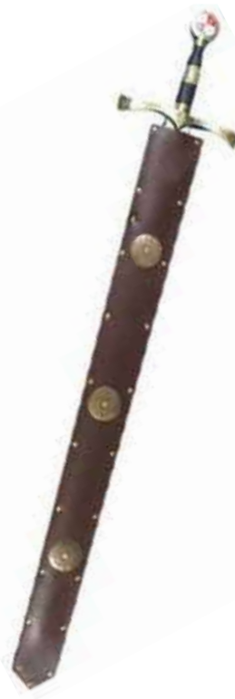
Vaina de espada