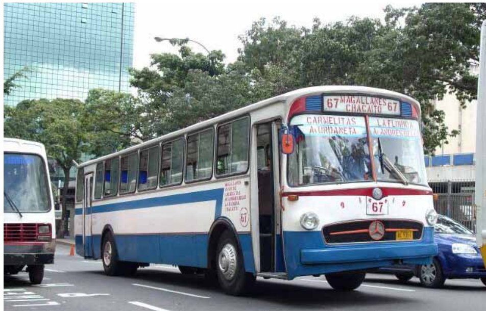
El recoge locos caraqueño va y viene todos los días

Palabra que deriva de valor y que, en lo material, se refiere al costo o precio de una mercancía: “¿Cuánto vale eso? Preguntó el comprador, “eso vale tanto”, responde el vendedor. “Cuánto tienes, cuánto vales”, es una frase usada para señalar el valor que tiene el dinero por encima de los seres humanos. En cosas del amor oírás a Julio Jaramillo lamentándose, musicalmente, “¡...tu amor, no vale naada! En otra situación es insultante y humillante: “Tú no vales, nada, ni un carajo”. A modo de decepción o rendición, el hablante dirá: “¡Noojoda! o, ¡noo vale, yo no sigo jugando!”. Vale en un tiempo fue palabra con la que se sellaba un acuerdo: “¡Ok, vale pues!, equivalente a “bueno está bien, vamos a echarle bolas” o “¡plomo!, o ¡fuego, váyalo!”