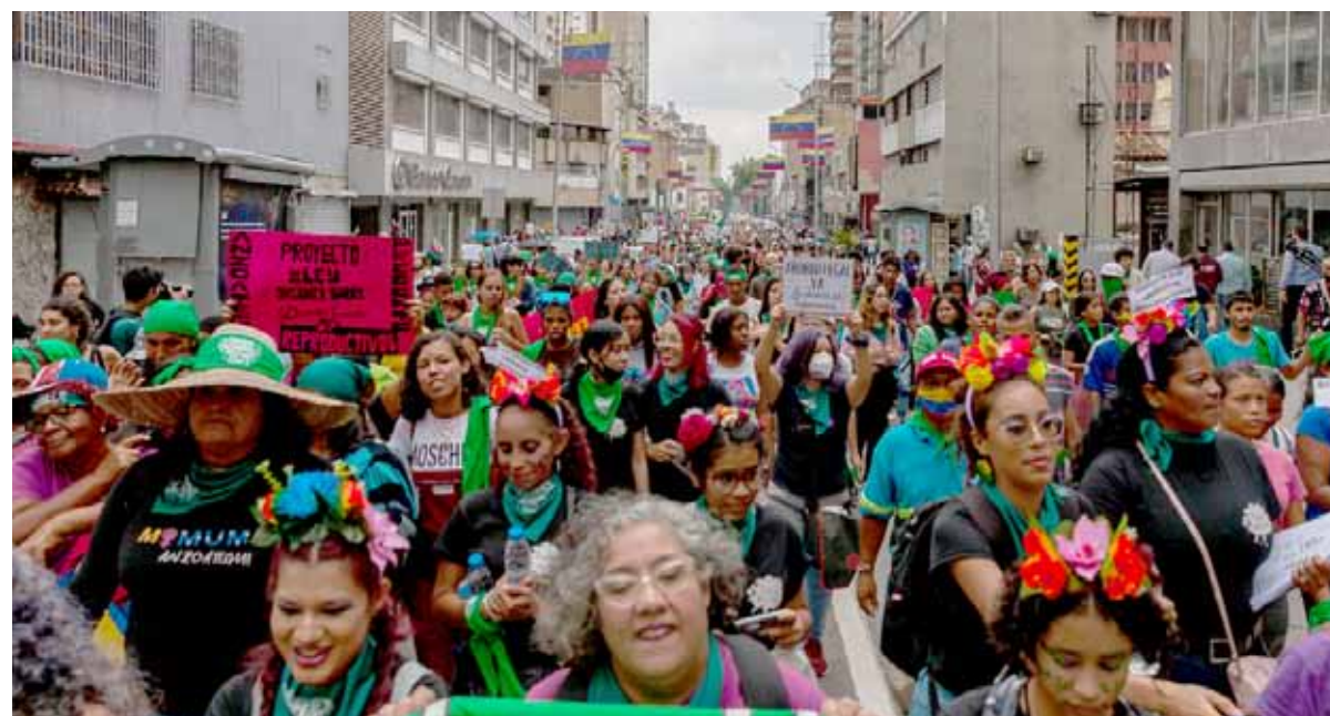
Por segundo año vamos a la calle, en defensa de nuestros derechos

La afluencia de las doctrinas y religiones generan desinformación y mitos en torno a la opinión de la sociedad civil.