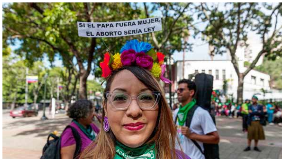
La falta de políticas para la interrupción voluntaria se traduce en desigualdad

trega, en el casino de La Candelaria, con música de la DJ Ceyrali, Elem MC, el performance Arge de Niyiré Baptista, mucho baile y un karaoke de voces agotadas pero felices de encontrarse y continuar por las luchas de lo que importa y es justo para el sector de mujeres de nuestro país.