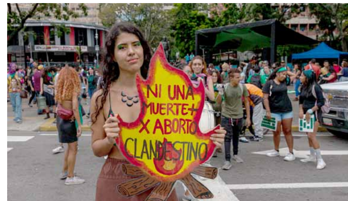
La clandestinidad aumenta los riesgos de quien decide abortar

Popurri Caribe, también estuvo en la actividad, nos da su mirada de quien recién vuelve al país: “Para mí fue mi primera experiencia de marcha, ya que no estuve en el país durante un período largo de tiempo. Me sentí contenta de ver una movilización grande con tanta diversidad incorporada, en cuanto a edad, etnia, posición social y política. Esto es muy