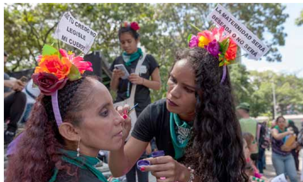
Juntas y juntos para dar el debate en las calles

Juntas finalizaron la actividad con su última parada para celebrar la movilización y la en-