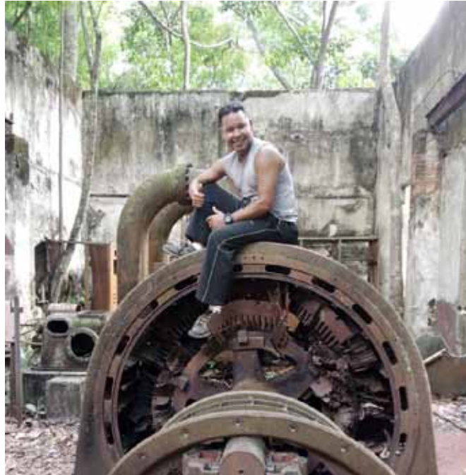
Sobran los destinos por visitar.