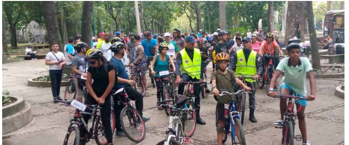
El Ministerio de Turismo celebró una rodada cicloturística por Caracas.

Este año el sector se une en torno al lema de “Repensar el turismo” para las personas y el planeta. La transformación positiva tanto para las personas como para el planeta fue el mensaje central del Día Mundial del Turismo de 2022. En referencia al turismo en Venezuela, An-