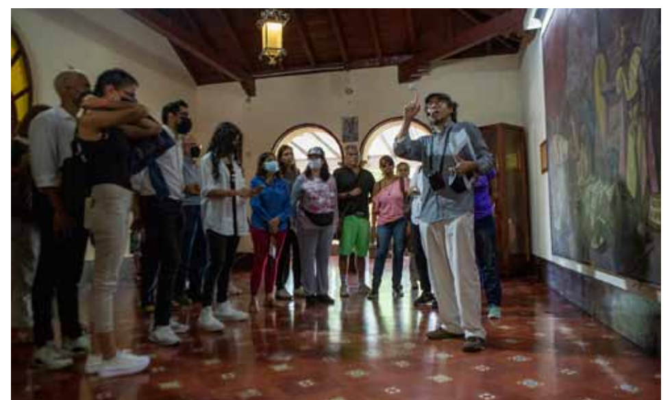
El 27 de septiembre se celebra el Día Mundial del Turismo