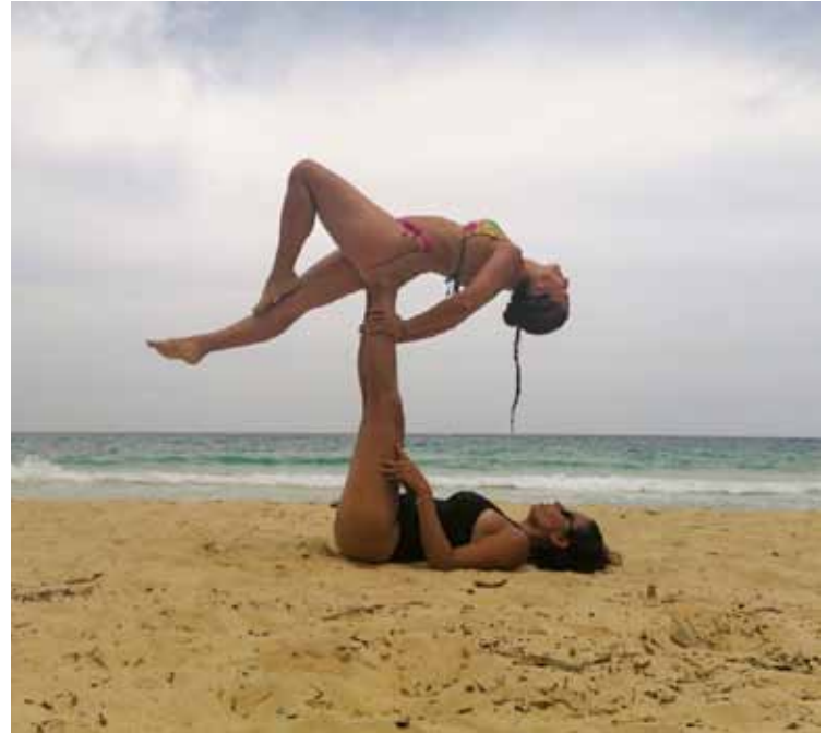
Pira Verde, nos ofrece paseos sustentables.