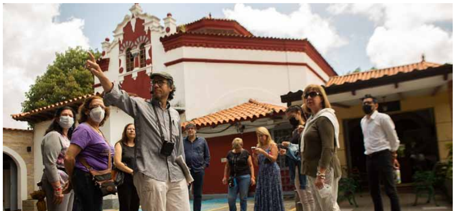
La Alcaldía de Chacao ofrece Arquitour : Turismo en favor del patrimonio