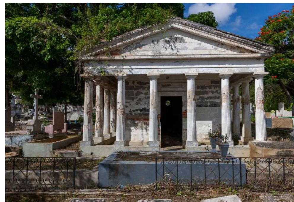
Personajes históricos fueron sepultadas en este cementerio

Con la necesaria reflexión anterior, el día de los muertos hicimos también un recorrido por los panteones más icónicos que albergan virtuosos venezolanos de nuestra ciudad; el