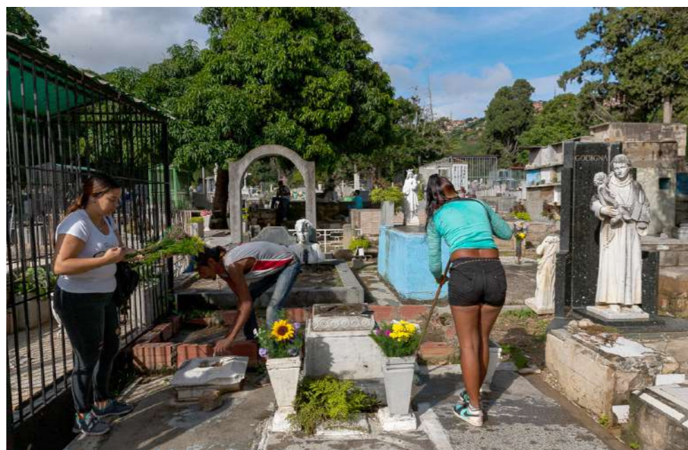
Visitantes aprovechan para limpiar las lápidas de sus familiares

En territorio “hostil” y con mucho prejuicio, inició el tránsito por sus hectáreas ante la mirada curiosa de los asistentes. El panorama pinta de otra forma en la opinión de cientos de familiares que aun sabiendo la condición del espacio no pierden la costumbre de visitar,