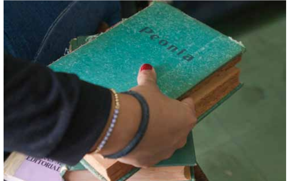
La fiesta del libro se va acercando cada vez más

cir, no necesita convertirse en un manifiesto. El escritor debe dejar que sea el lector quien llegue a las conclusiones a las que lo invita.