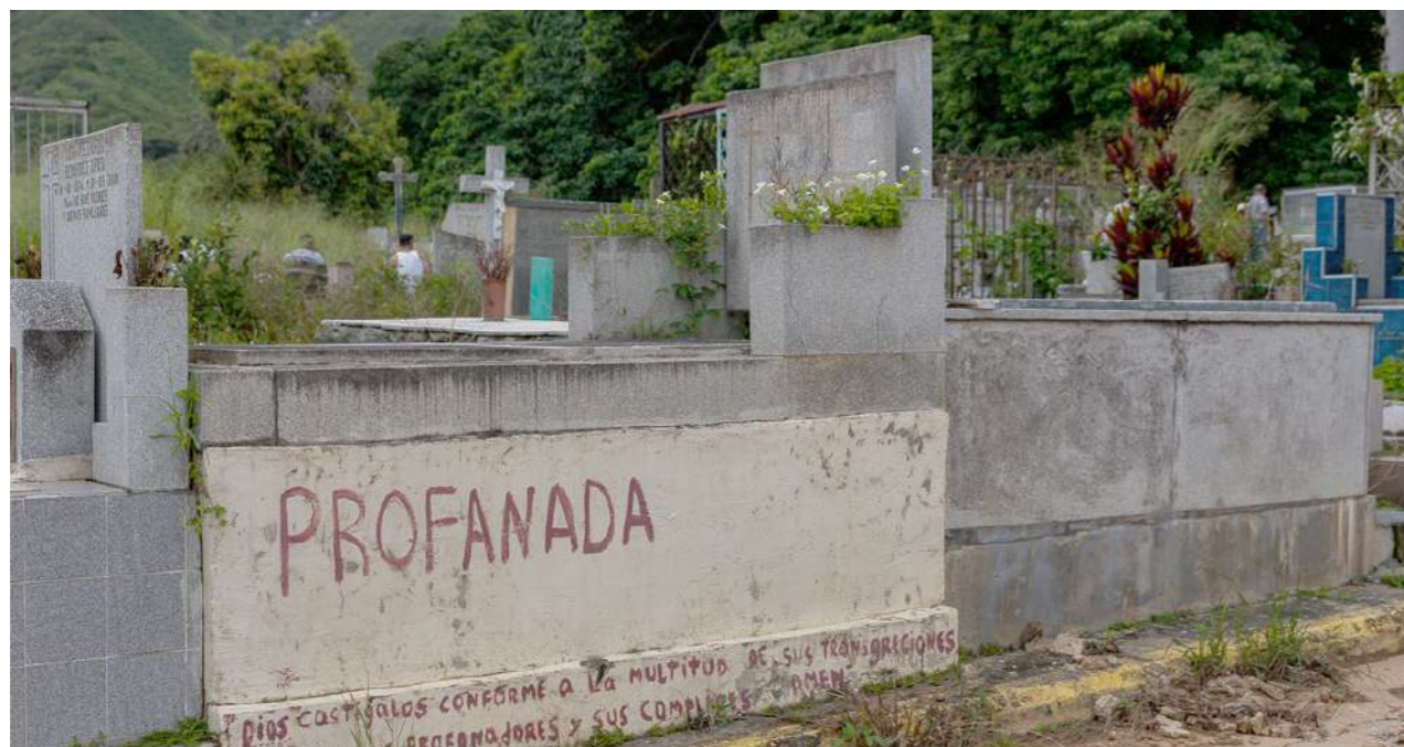
Varias urnas han sido profanadas por la delincuencia

Siendo poco más de las ocho y media de la mañana ya nos encontrábamos en la puerta del cementerio del sur. En los últimos años dicho cementerio ha sido motivo de múltiples discusiones ya que por su condición geográfi-