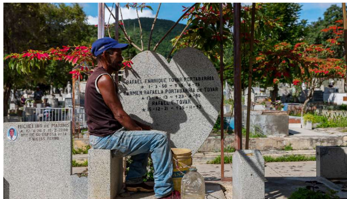
Reencontrarse y abonar el amor a quienes ya no están en este plano

Aunque se puede transitar y se comenta que se han abierto caminos entre las calles que por la lluvia dividen las parcelas y se llenan de barro, han limpiado los terrenos de maleza y al menos en este día hay bastante presencia policial; la dificultad de pasar por lápidas flojas, entre tumbas, para llegar al nicho del ser querido, representa aún una caminata de riesgo. Necesario es incentivar los esfuerzos por la restauración de este espacio, la correcta vigilancia del recinto para la paz de los familiares que quedan en vida y que son afectados al enterarse de que una tumba familiar fue saqueada y