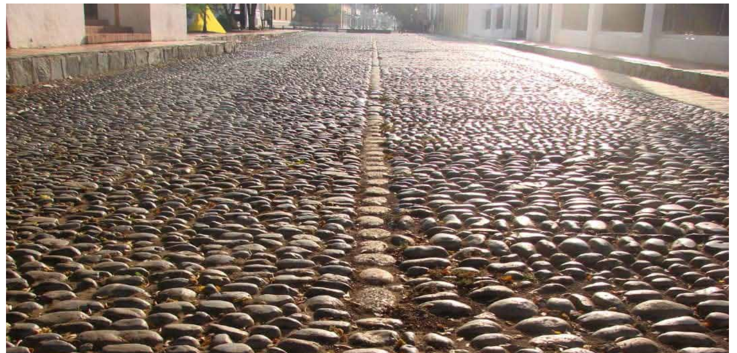
Una fotografía identitaria, desprovista del elemento humano.

— En mi fotografía de los valores identitarios y patrimoniales de la venezolanidad, es escasa la presencia humana y se da más en color que en blanco y negro. Es que la vida es muy dinámica y en el color me influenciaron mis propios estudiantes, mientras que en blanco y negro, que viene de más atrás, estoy más libre de influencias. La presencia humana está más en el color. Yo tengo cuatro temas: naturaleza, pesca artesanal (aunque nunca saco a los pescados, mi fotografía es vegetariana), mercados tradicionales y arquitectura. █