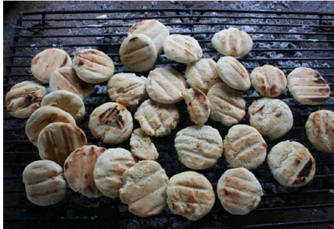
Raydán huye de lo artificioso: prefiere lo silvestre, lo artesanal.

— En mi archivo hay más fotografías de Falcón que del Zulia, porque la vida es azarosa. Yo fui cinco años jefe del departamento de prensa de la gobernación de Falcón y eso me permitió dar vueltas por esa entidad como nunca en la vida tuve oportunidad en mi estado natal. Ahora, yo soy un venezolano nacido en Maracaibo, pero soy un venezolano. Esas dos identidades, la nacional y la local, en mí viven armoniosamente. Yo soy un orgulloso zuliano, pero soy venezolano y latinoamericano, y también soy universal, entonces lo que hay es que promover lo local con visión universal.