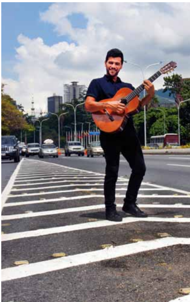
Todo surgió como un laboratorio

—Estuvimos unos tres o cuatro meses allí, ya no estamos. Fue una experiencia bonita. La idea inicial más bien se ha fortalecido, más bien, ha crecido en cada uno de esos ámbitos, porque nacimos con la impotencia de no tener un espacio físico, y hemos entendido con el tiempo que tenemos muchos espacios aliados desarrollando propuestas. Es decir, cualquier lugar en nuestra casa, plaza, parque, locación; como el agua nos adaptamos al recipiente que nos ofrezcan y nos filtramos por cualquier estructura. En realidad, el proyecto no ha cambiado, sino que tiene muchas ramas.