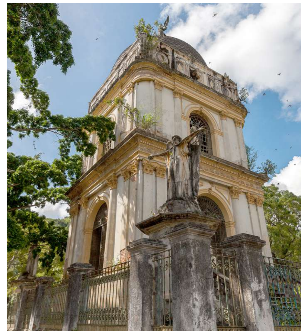
Lugares arquitectónicos son vistosos en el lugar

En torno al Mausoleo de Joaquín Crespo, construido en 1898, quedan sus ruinas saqueadas, una imponente capilla con un árbol frondoso a su entrada y en el cual orbitan en danza nupcial al menos centenares de golondrinas, uno de los ejemplos