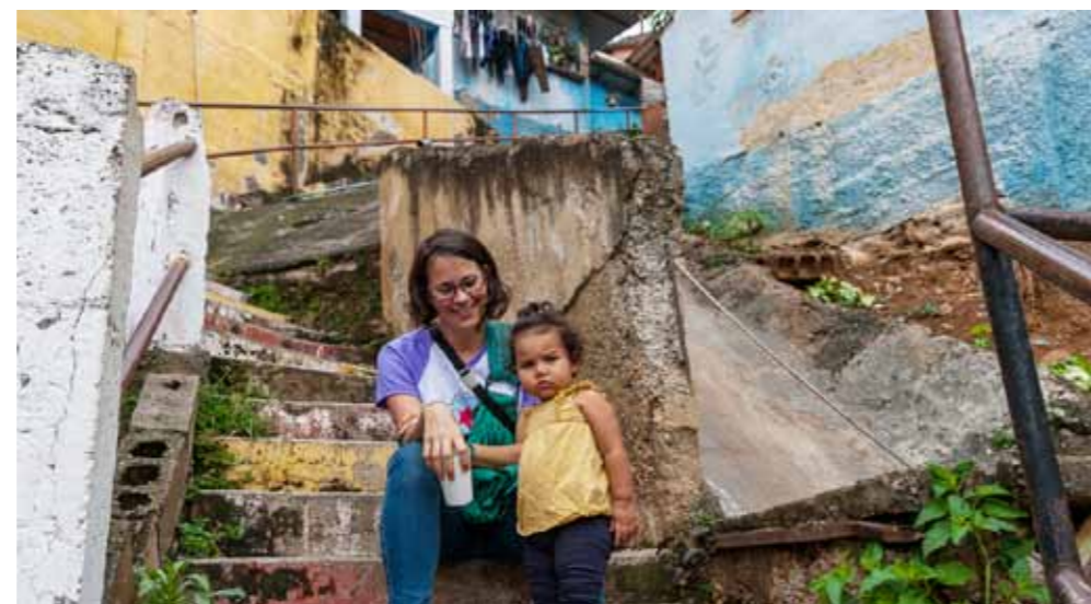
Más de 300 escalones subimos hasta llegar a la Morada

Esta es una de las actividades importantes que se realiza en la Morada, pero también hacen cine foros, formaciones en maquillaje y manicure, talleres de sexualidad, etcé-