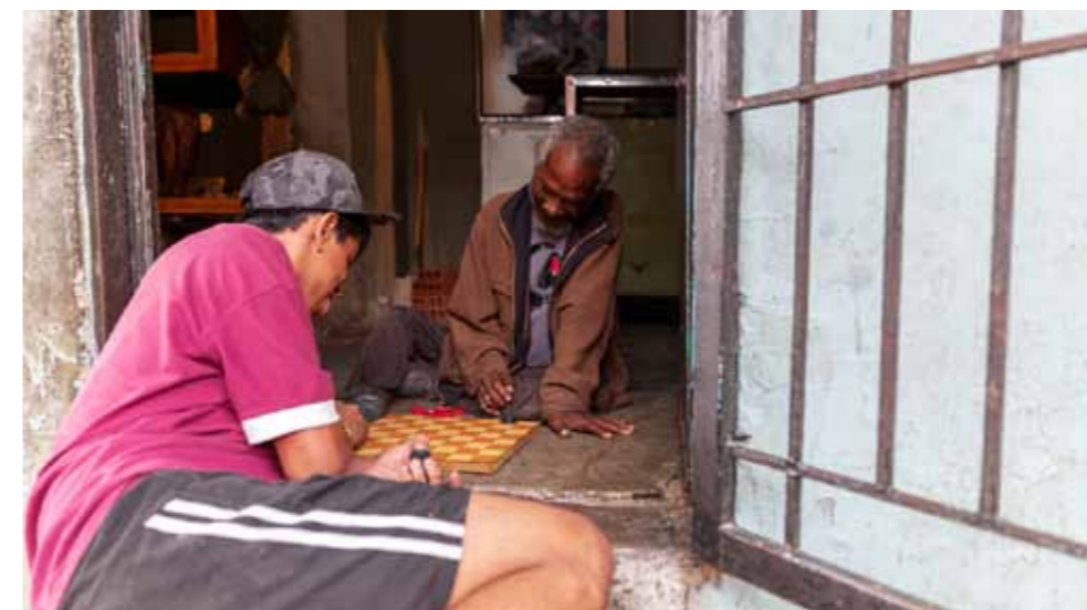
Los juegos cotidianos fueron parte del escenario

Al llegar a la Empresa de Producción Social Directa Comunal (EPSDC) Centro de Distribución y Comercialización Somos Karive, antiguo Mercal que fue entregado como una transferencia al poder popular por orden del presidente de la República Nicolás Maduro, el 25 de mayo de 2022 a la Comuna 5 de Marzo, ahí nos esperaban varias personalidades para escuchar más de la experiencia.