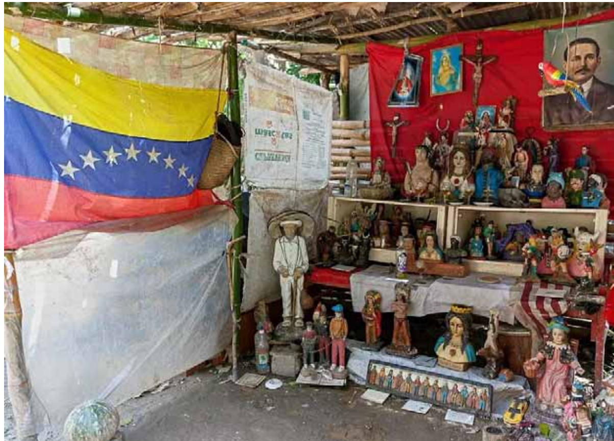
Guaicaipuro es el segundo a bordo en los altares del espiritismo

logró armar la primera confederación de las tribus para luchar contra el hombre blanco”.