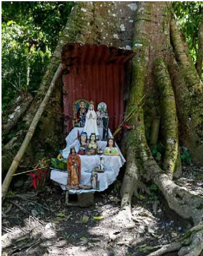
Su figura mística es una de las más respetadas por el pueblo