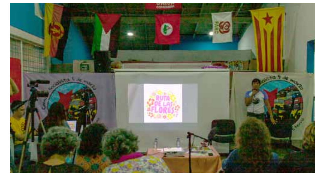
La presentación del cuento de la Ruta de las Flores cerró el encuentro

“Soy madre soltera de dos chamos de padres distintos, y quien nunca me negó el apoyo fue mi mamá, otra mujer abandonada a la buena de Dios conmigo”.