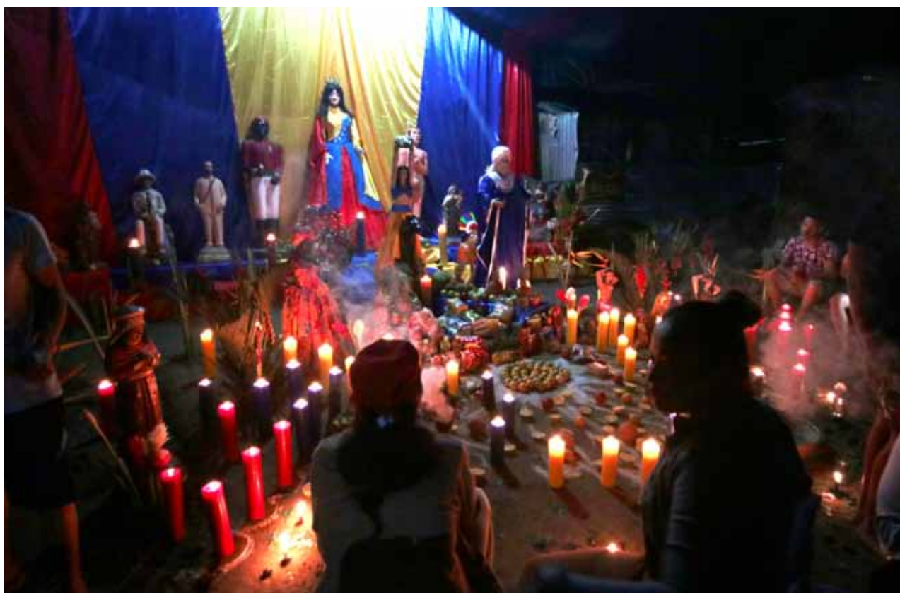
Preside la Corte India como gran cacique que fue en vida y ahora es desde el más allá.

Las promesas de por vida, las costumbres sacralizadas, los dogmas, la fe. “Primero Dios, luego Guaicaipuro” insisten los “materia” que circulan por la plaza. “Ana Karina Rote” grita el Tigre antes de entregarle el estandarte tricolor a otro oficiante con esperanza ilimitada. █