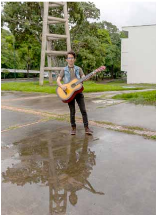
Hace “lives” para mantenerse conectada con sus seguidores