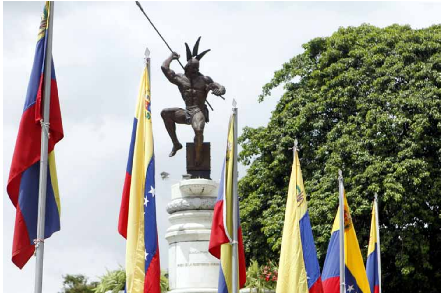
El Guaicaipuro de la plaza Venezuela también refleja el rostro aguerrido del líder aborígen

Es cinco de noviembre y se desata una lluvia soleada sobre la plaza. Es un episodio extraño pero natural, cargado de