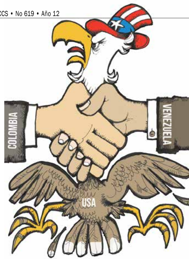
LA GUERRA CONTRA LA CORRUPCIÓN VA EN SERIO