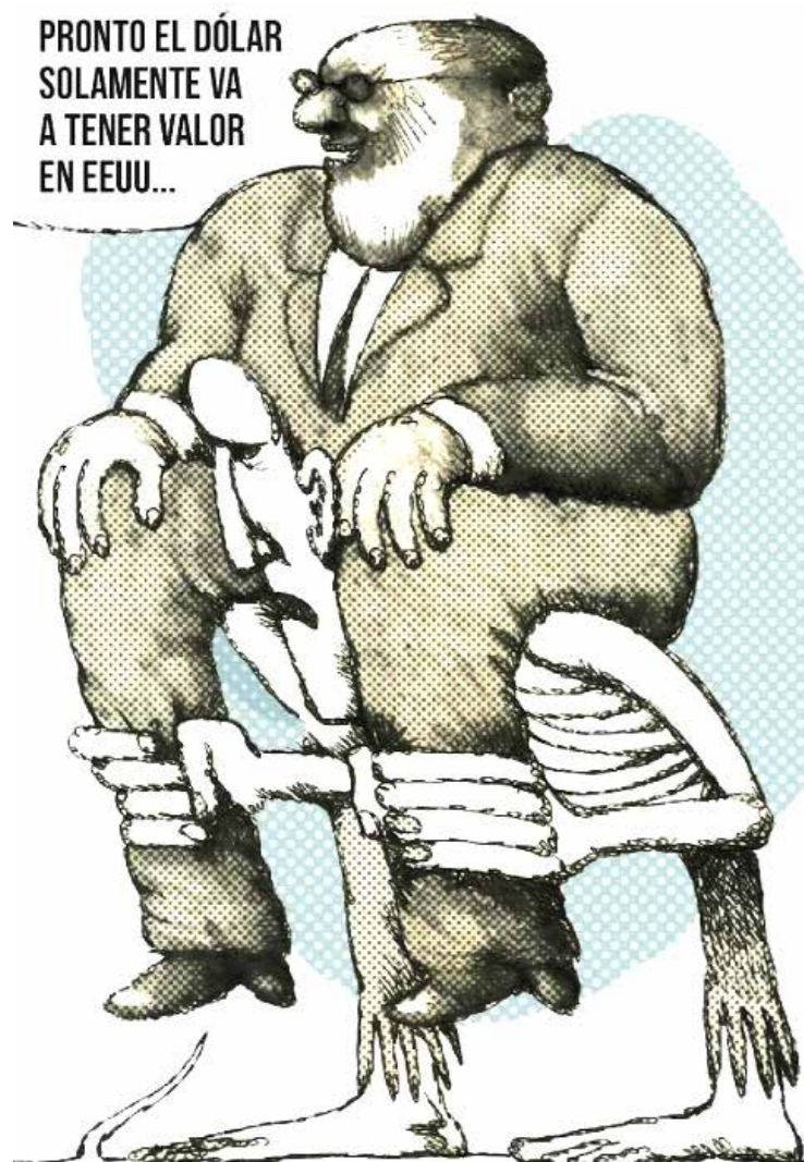
...Y EN VENEZUELA