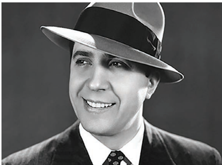
Carlos Gardel, El morocho del abasto .

recogió estos momentos históricos, y la avalancha de gente apenas si dejaba mover el vehículo en el cual se transportaba Gardel. No hubo otra alternativa sino bajarse del automóvil, y hacer el trayecto a pie hasta su lugar de destino. A lo largo del recorrido se sumaban más y más personas, y se confundían hombres, mujeres, niños y ancianos en aquella bienvenida.