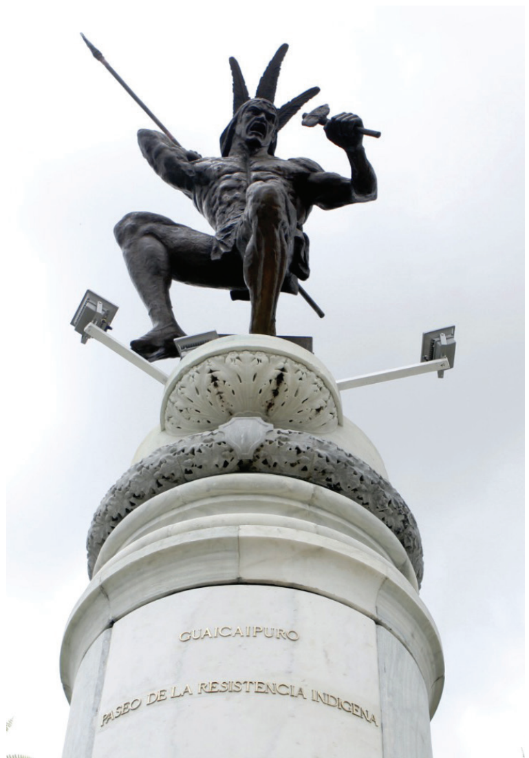
El Paseo de la Resistencia Indígena, ahora luce al indio Guacaipuro como parte de la transformación.

Adicionalmente, Caracas fue el término utilizado por los conquistadores para referirse a las tierras de nuestros pobladores originarios, que para esa época estaban comprendidas desde Valencia hasta Barlovento. Los primeros españoles que arribaron a estas tierras escucharon de la boca de nuestros ancestros la palabra Caraca o Caracas, con la cual se referían a una planta herbácea medicinal y comestible que abundaba (y aún abunda) en esta zona.