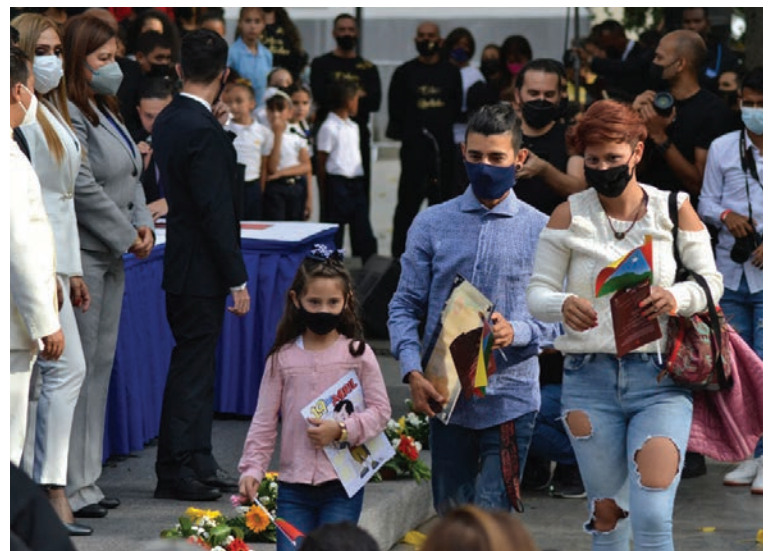
Cultores, cultoras y autoridades festejaron juntos la descolonización de Caracas.

mos con una identificación gráfica que determinara nuestra ciudad. Así que el 27 de febrero del año en curso se creó la comisión especial para los símbolos del Municipio Bolivariano Libertador. Esta comisión estuvo integrada por 17 miembros de diferentes instituciones históricas, con ellos realizamos varios estudios y análisis para ir descolonizando, a través de los símbolos, la ciudad de Caracas”, indicó Vivas.