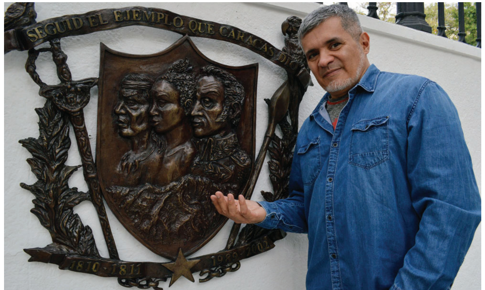
Personajes históricos, fechas insignes, guacamayas y la estrella de la revolución ahora son parte de la identidad de Caracas.

Estudí y descubrí cosas que a mis 60 años no había visto en profundidad. Lo que oculta el escudo colonial de Caracas. En eso me fui inspirando a participar, aún más, con elementos gráficos, salidos incluso de lo convencional. Porque yo sé que en los escudos muy poco se usan las figuras humanas, los rostros. Se usa más simbología. Pero me atreví a reivindicar lo que es nuestra verdadera nacionalidad. A través de nuestro insigne caraqueño Simón Bolívar, acompañado por una mujer. El color de la mujer, no es una