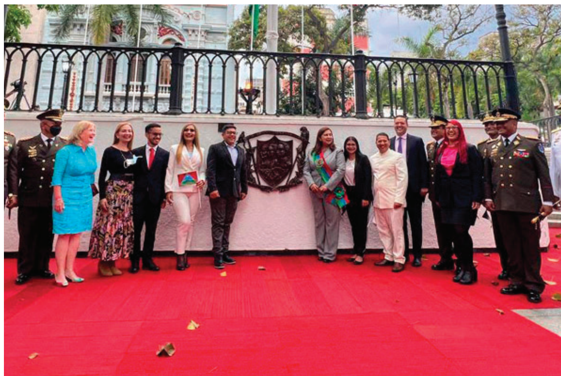
A 212 años del inicio de la independencia, autoridades de Caracas, presentaron los símbolos que derrotan al colonialismo.

—Tengo un proyecto hermoso que no es solamente para Caracas sino para Venezuela entera. Que es convertir el Palacio Municipal en un museo de historia. Que sería el primer museo de cera en Caracas y en Venezuela. Hechas con calidad y al nivel de otros