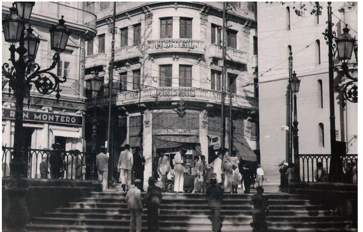
Teatro Principal en la Plaza Bolívar de Caracas, donde se presentó El Rey del Tango .

Dos horas tardaba el trayecto en ferrocarril desde La Guaira hasta la Estación de Caño Amarillo, en Caracas. Seguramente Gardel y sus acompañantes se deleitarían con el paisaje imponente de los cerros por los cuales serpenteaba la máquina, así como debieron apreciar el cuadro del valle caraqueño que se presentaba ante sus ojos, con su imponente guardián el Waraira Repano. La apoteosis fue total cuando el tren se detuvo en su punto de llegada, y un grande número de personas pujaban entre sí por acercarse a ver al cantante. La prensa de la época