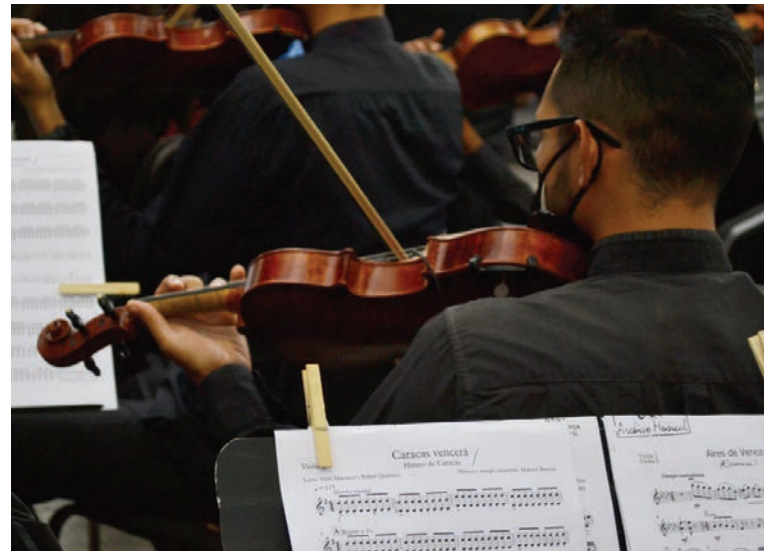
Entonaron el nuevo himno para dar a conocer la letra y música.

“Los símbolos de la capital estaban derogados desde el 2015, esto quiere decir que no contába-