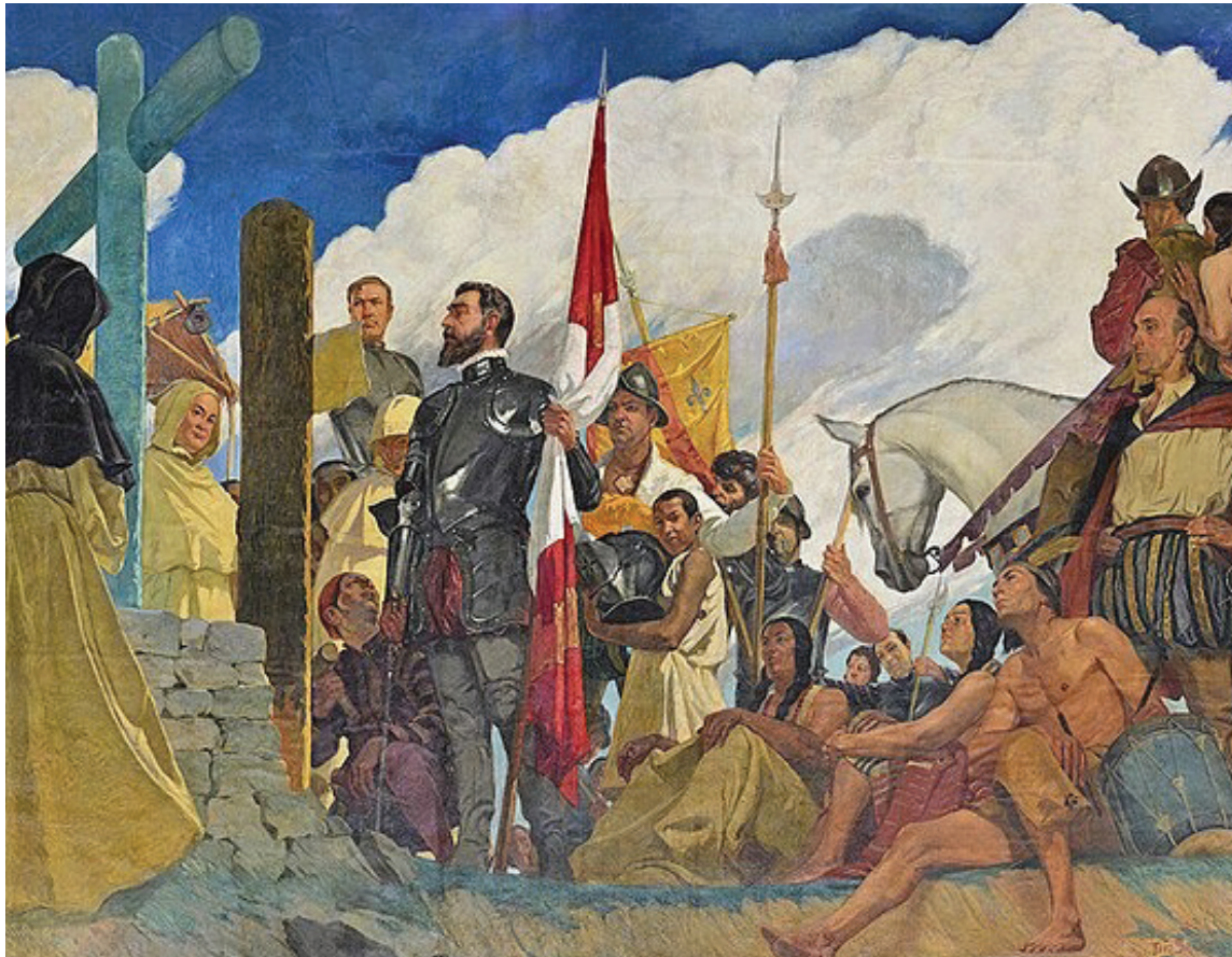
Se utilizaba el apellido de gobernantes para colocar nombre a territorios conquistados.