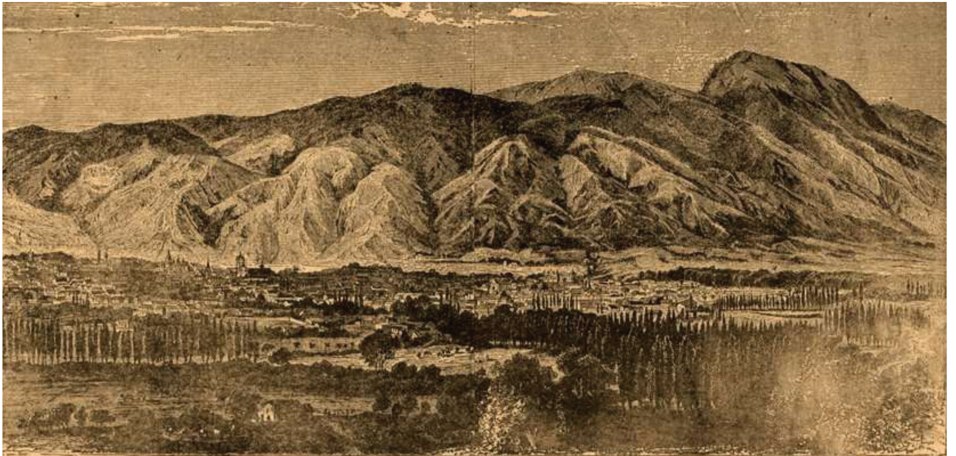
El Valle de Caracas con la imponente montaña renombrada Waraira Repano. En las faldas de ese monumento natural los caraqueños hacen vida.