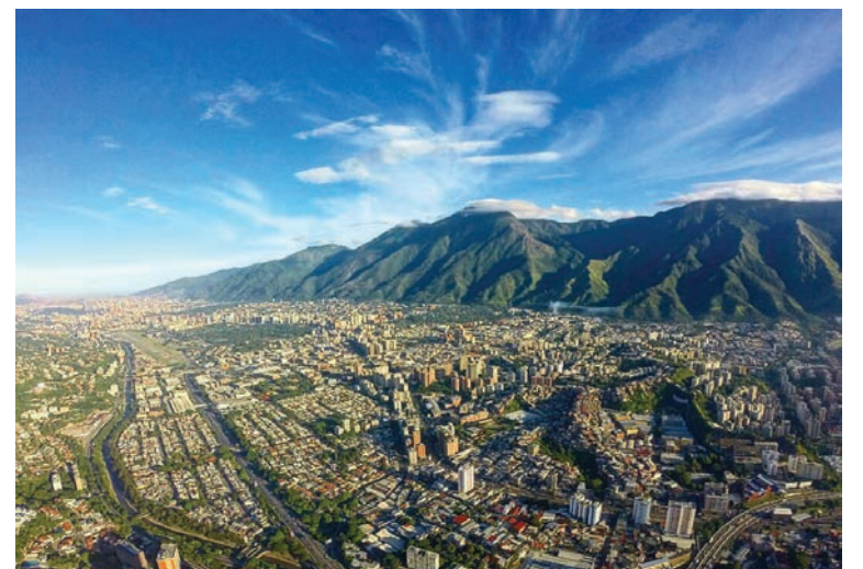
Una ciudad poblada que mantiene la memoria oral en cronistas y memoria viva

de Caracas” de los textos y actos oficiales, ya que dicho calificativo en ese contexto histórico se convirtió en sinónimo de genocidio de nuestras tribus regionales, así como la apropiación de sus tierras, de la misma manera como lo plantearon nuestros próceres de la Independencia.